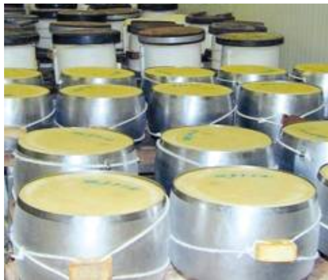
● Forme di Parmigiano-Reggiano poste in fascere per incidere sullo scalzo i marchi d’origine.

La valutazione sensoriale del Parmigiano-Reggiano è svolta già da alcuni anni da diversi laboratori situati nel comprensorio di produzione del formaggio Dop. Le schede di assaggio impiegate dai diversi panel differiscono però leggermente per numero e tipologia di descrittori e per l’ampiezza della scala di valutazione. Le analisi risultano corrette metodologicamente, ma i dati che vengono forniti non possono essere confrontati