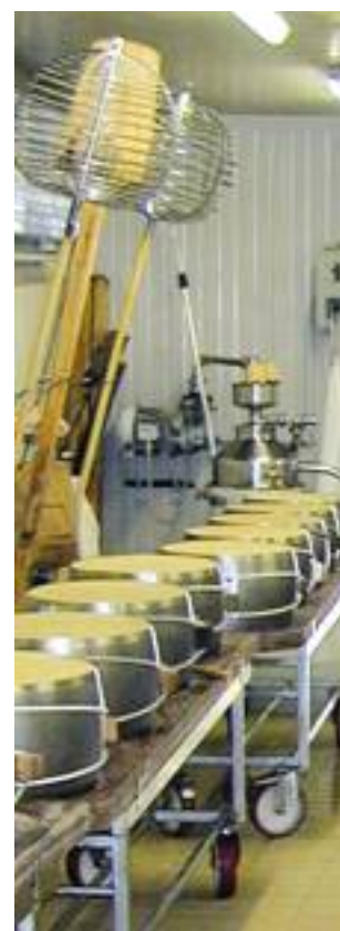
● Parmigiano-Reggiano in fascere e strumento per la spinatura della cagliata.

✓ distinguono meglio i campioni fra loro; ✓ sono più facilmente comprensibili da parte dei giudici;