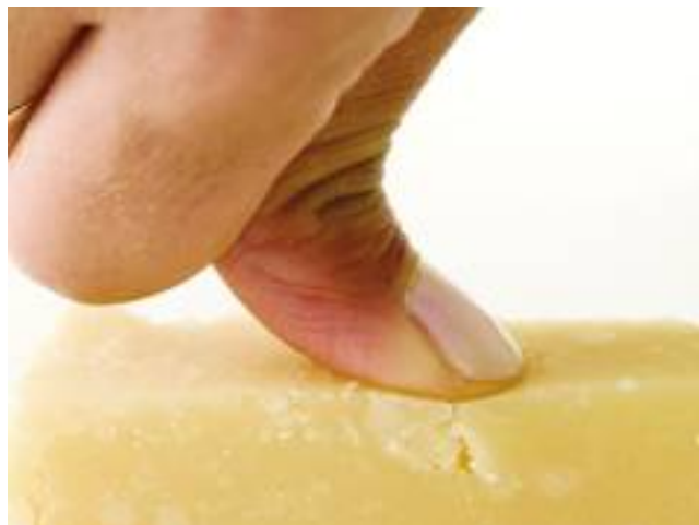
● Valutazione di un campione di Parmigiano-Reggiano durante un test sensoriale in laboratorio.

Come evidenziato in figura, il colore giallo paglierino (descrittivo visivo) risulta più accentuato nel formaggio