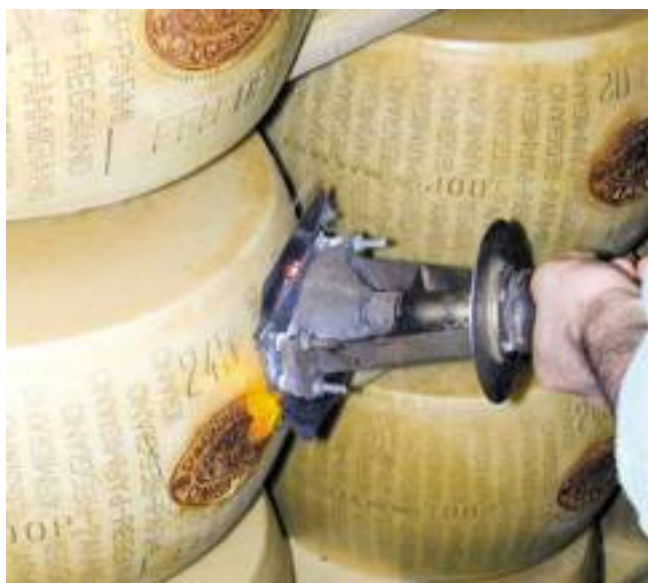
● Marchiatura a fuoco di forme di Parmigiano-Reggiano.

per la loro effettiva capacità di discriminare le caratteristiche di diversi campioni di prodotto.